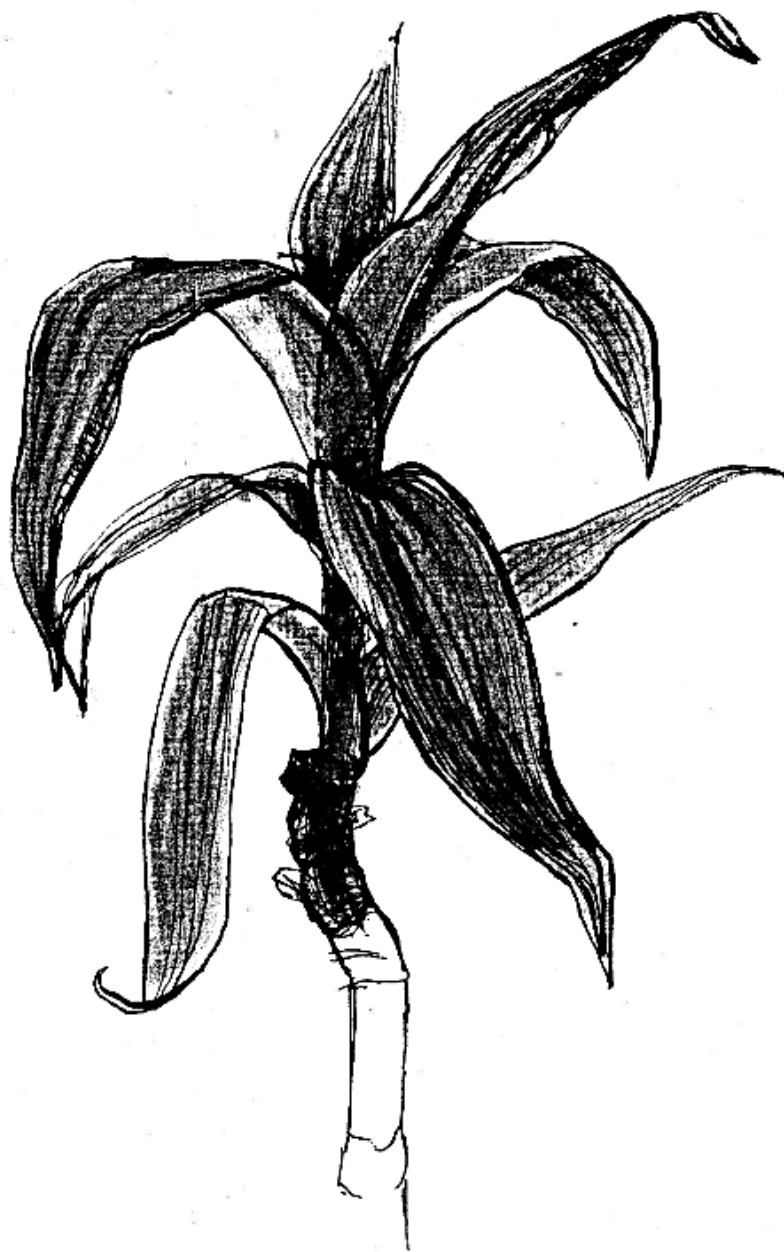
obr. 1 „Kalisie“

Vždy je nutno dodržovat přesné dávkování uvedené v recepturách. Při objevení se alergie nebo při jiných potížích přestaňte odvary, listy a extrakty používat.