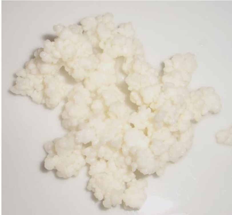
tibetská houba na výrobu kefíru