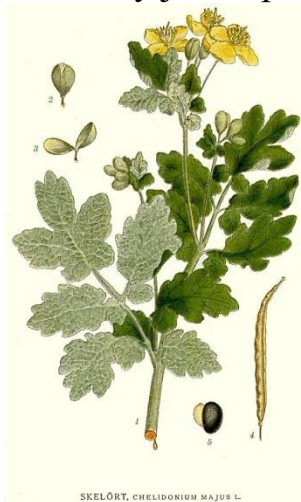
SKELÖRT, CHELIDONIUM MAJUS L.

Vlastovičnick nejraději roste na jižních okrajích lesa, při zdech, plotech, na rumištích. Ať je již léto jakkoliv suché, i když jsou jižní stráně vyprahlé, ze stonku vždy vytéká mnoho oranžovožluté šťavy. Vlastovičnick však najdeme i v zimě, kdy je vše pokryto sněhem, pokud jsme si zapamatovali místo, kde roste.