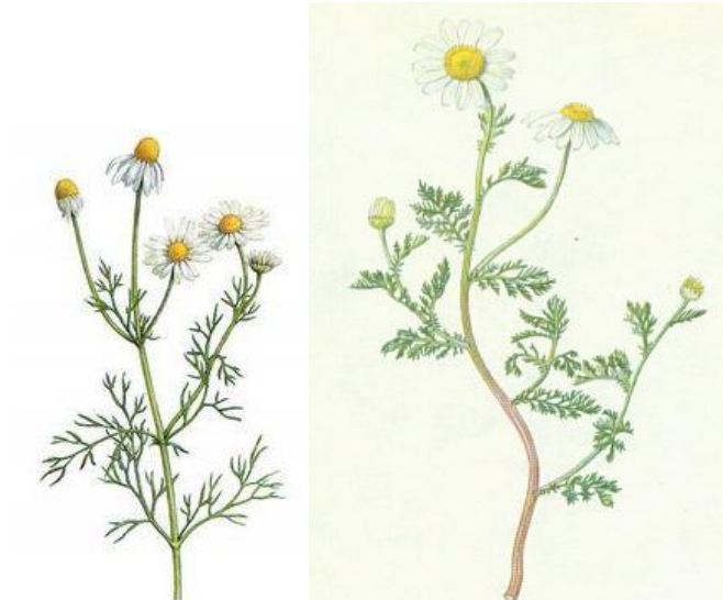
Vlevo heřmánek pravý, vpravo rmen rolní